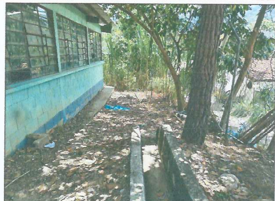
Foto 4: Mejorar las cunetas y bajadas de agua pluvial con un alcantarillado respectivo.

Observación: Si es necesario se pueden agregar hojas adicionales y actualizar el número de hojas.