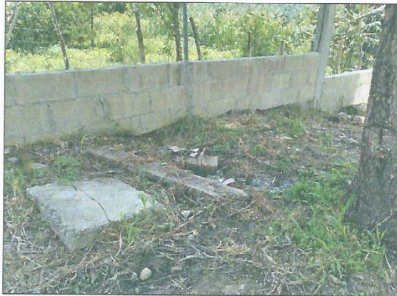
Foto 1: Fosa séptica donde se encuentra el biodigestor rotoplas para los sanitarios.